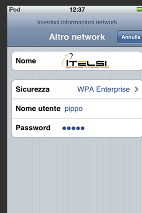
Inserire manualmente NOME E PASSWORD