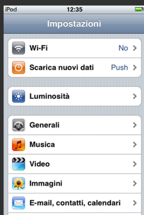
Toccare l'impostazione WI-FI