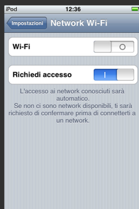
Attivare la connessione WI-FI